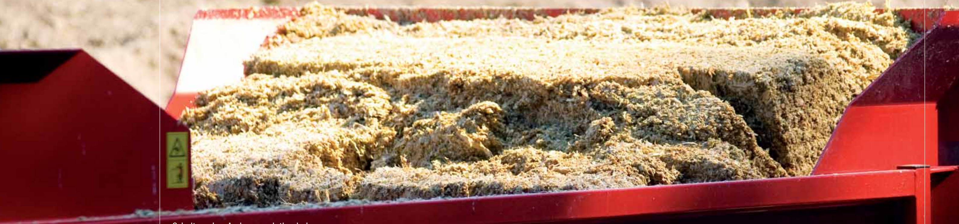
Schuitemaker Amigo: en rigtig vinder.